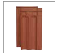
Rouge Cuivre Engobe