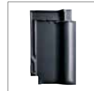
Gris Schiste Engobe