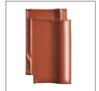
Rouge Cuivre Engobe