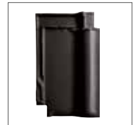
Noir Mat Engobe