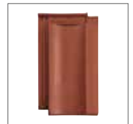
Rouge Cuivre Engobe