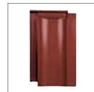
Rouge Lie-de-vin Engobe